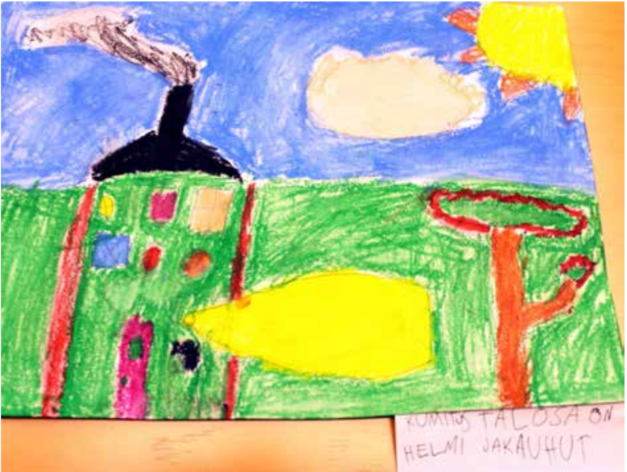
KUMITUS TALOSAON HELMI JAKAUHUT